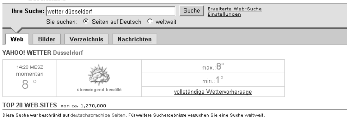
Abbildung 3: Integration von Wetterinformationen in die Ergebnisdarstellung

bieter ihre Datenbank-Inhalte erschließen lassen können, gibt es ein solches auch für Non-Profit-Organisationen. Bisherige Partner, deren Datenbank-Inhalte in die Yahoo!-Suche eingebunden sind, sind unter anderem die Library of Congress, Wikipedia und das Projekt Gutenberg.